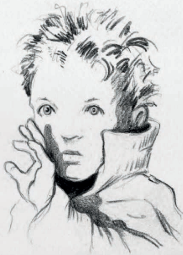
Croquis préparatoires de Michel Hazanavicius

C'est l'histoire. L'histoire imaginée par Jean-Claude Grumberg, c'est elle qui a balayé toutes mes certitudes en la matière. C'est une histoire profonde, puissante, humaniste, en même temps que délicate et modeste, et qui m'a semblé être un classique instantané quand je l'ai découverte, avant même sa publication. C'est pour moi, en tant que réalisateur, ce qu'il y a sans doute de plus difficile : trouver une histoire qui vaille le déplacement. On peut toujours trouver des bonnes scènes, des bons acteurs, des bonnes situations, des bons moments de