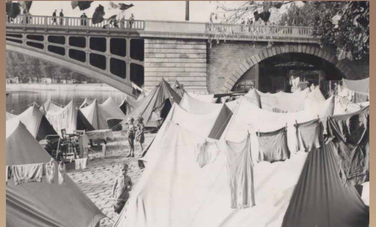
Les arches du Pont de Sully

Chaque année, près de 150 000 assignations pour expulsion sont prononcées, donnant lieu à une moitié de commandements à quitter les lieux, dont 15 000 à 16 000 sont réalisées avec l'intervention de la force publique. Le tiers des familles expulsées ne parviennent pas à retrouver de logement stable, vivant en hôtel, caravane, camping ou chez un tiers. (Source : lacroix.fr, lemonde.fr)