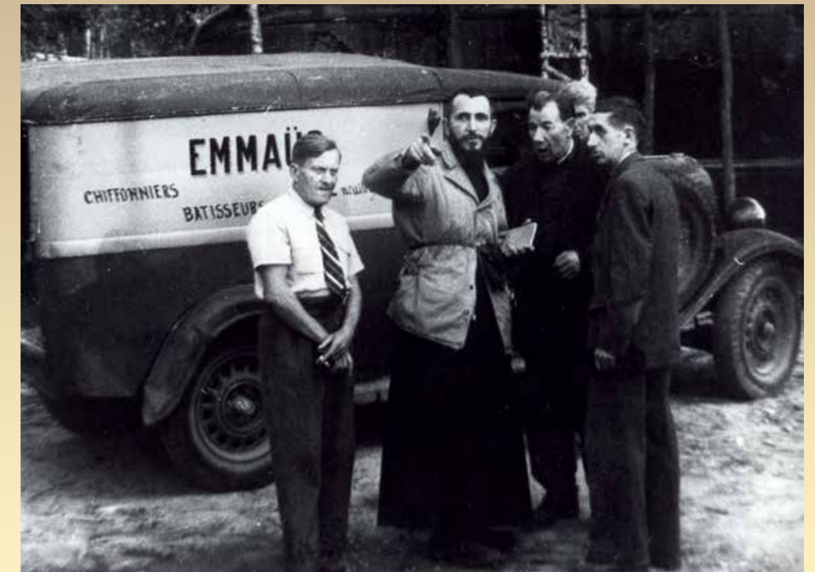
Neuilly-Plaisance, la première communauté d'Emmaüs