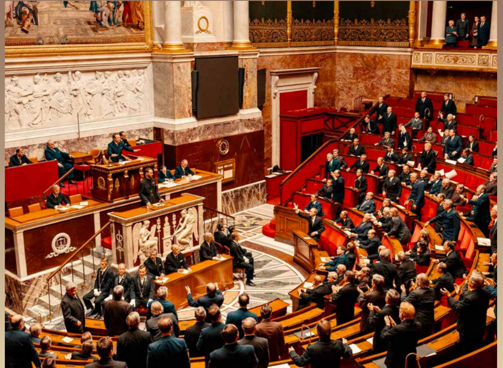
L'abbé Pierre à l'Assemblée Nationale, dans le film

L'intuition de l'abbé, à l'origine des compagnons d'Emmaüs, tient dans l'idée qu'aux désespérés il faut proposer du sens. Le secours peut consister à donner un toit ou des repas, mais il faut surtout leur donner les moyens de revenir parmi les vivants. C'est la raison pour laquelle parmi les premiers membres de la communauté on trouve d'anciens maquisards et des collabos, d'anciens détenus qui ont en commun pauvreté et marginalité. Pour leur éviter l'humiliation de la charité à laquelle il a eu lui-même recours à deux reprises, l'abbé Pierre partage