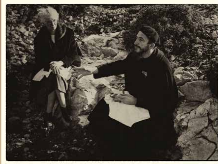
L'abbé Pierre et Lucie Coutaz (Crédit photo : Emmaüs International)

L'abbé Pierre lance un appel à l'aide sur RTL