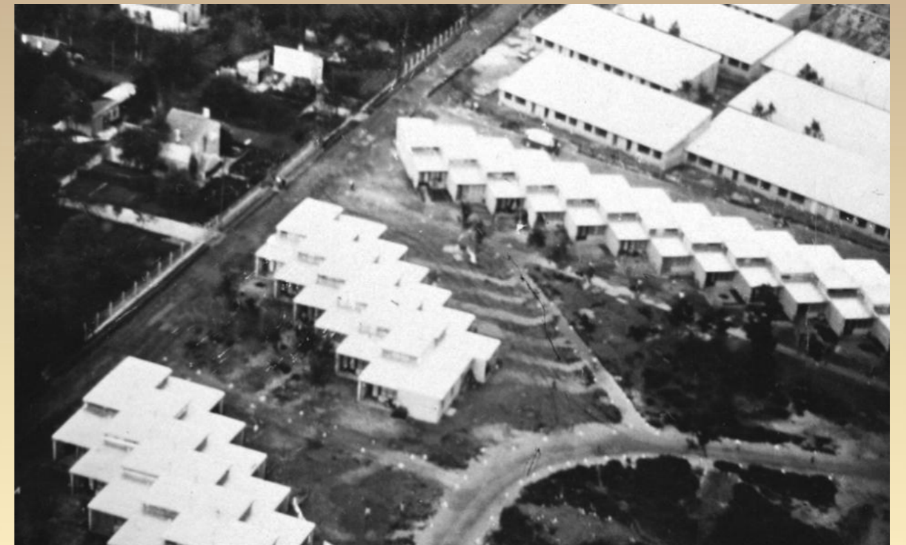
Les premières H.L.M.