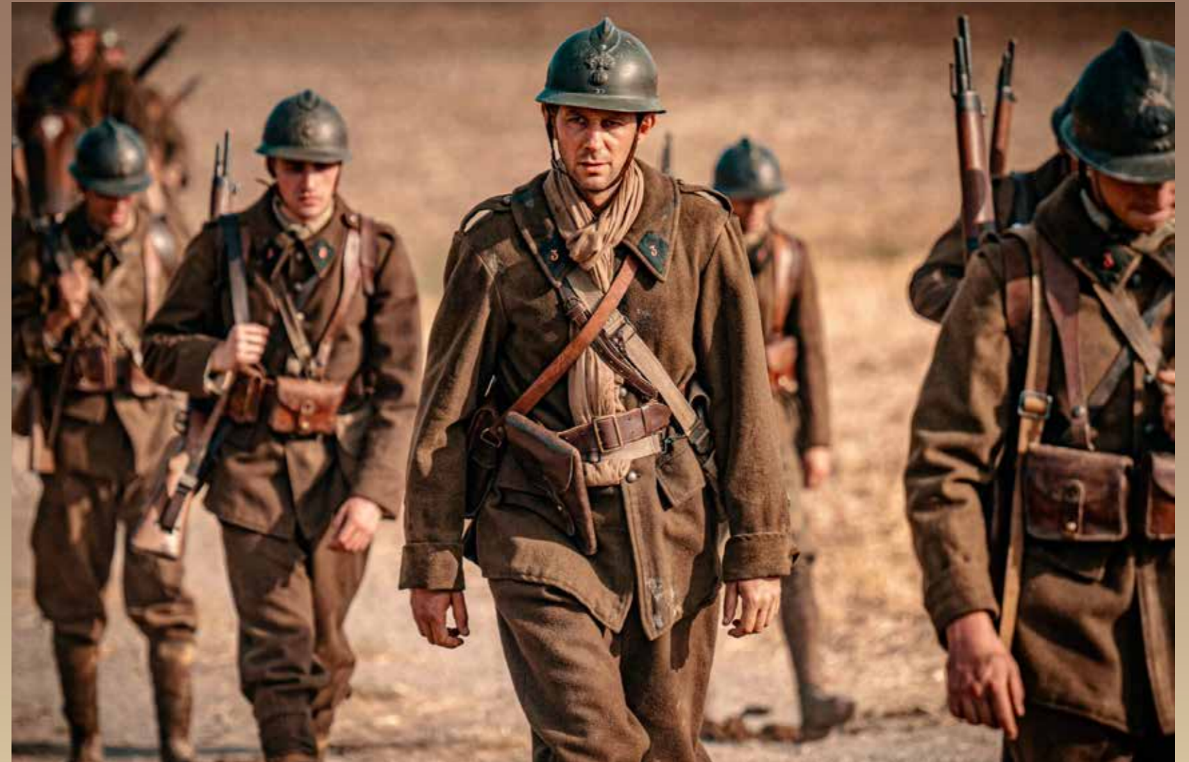
Henri Grouès soldat, dans le film

Dans ces conditions, rejoindre la résistance est pour un catholique, et plus encore pour un ecclésiastique comme l'abbé Pierre, un geste de désobéissance en même temps qu'une réelle remise en question des valeurs portées par l'institution. Ce geste est accompli par les démocrates chrétiens et les syndicalistes chrétiens qui se trouvent dans la France Libre dès 1940-41, le plus souvent par refus de la défaite, et dont une partie d'entre eux (Teitgen, Menthon...) fondent le journal Liberté .