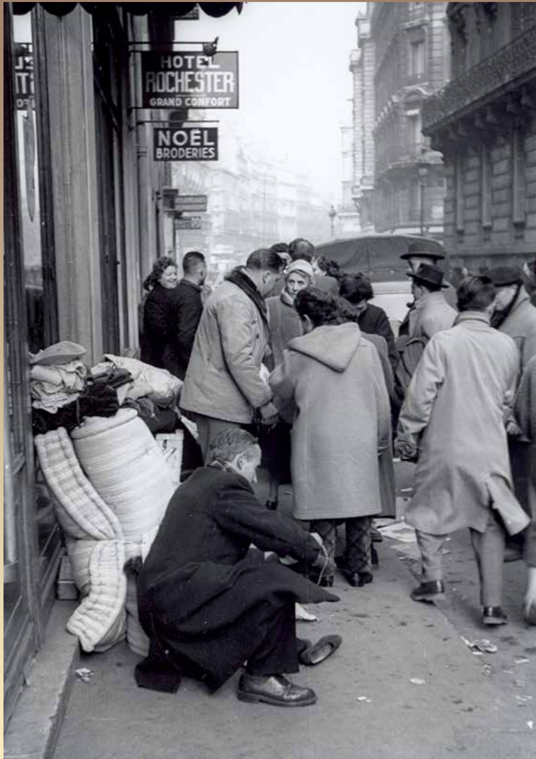
Devant l'hôtel Rochester, hiver 1954