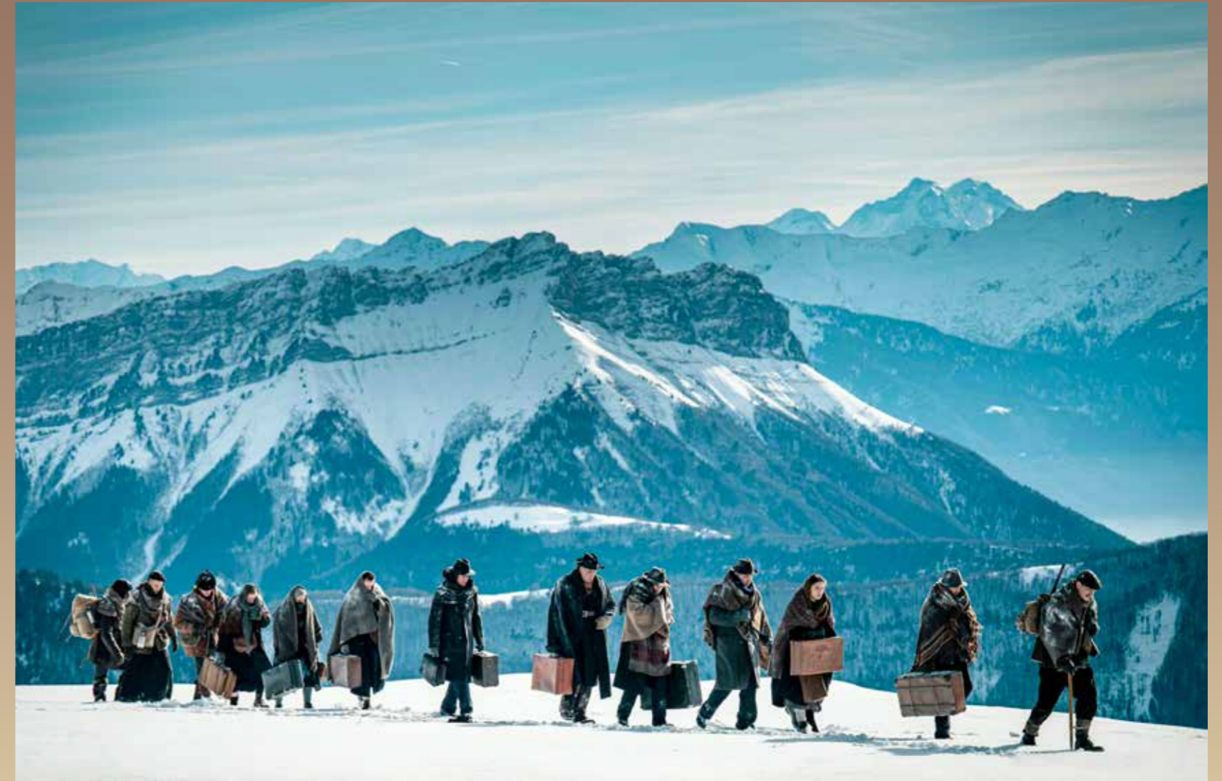
Le passage vers la Suisse, dans le film

Le drame des Glières de mars 1944 n'est que le début des opérations de répression de l'été 1944. Pourtant les maquisards ne baissent pas les bras et, avec les débarquements de Normandie et de Provence, les effectifs repartent à la hausse, jusqu'à atteindre 450,000 hommes, avec des meilleurs équipements parachutés par les alliés, et finalement davantage de succès stratégiques sous la supervision des Forces Françaises de l'Intérieur (FFI). Leur action permet de gêner la progression de la Wehrmacht et des SS.