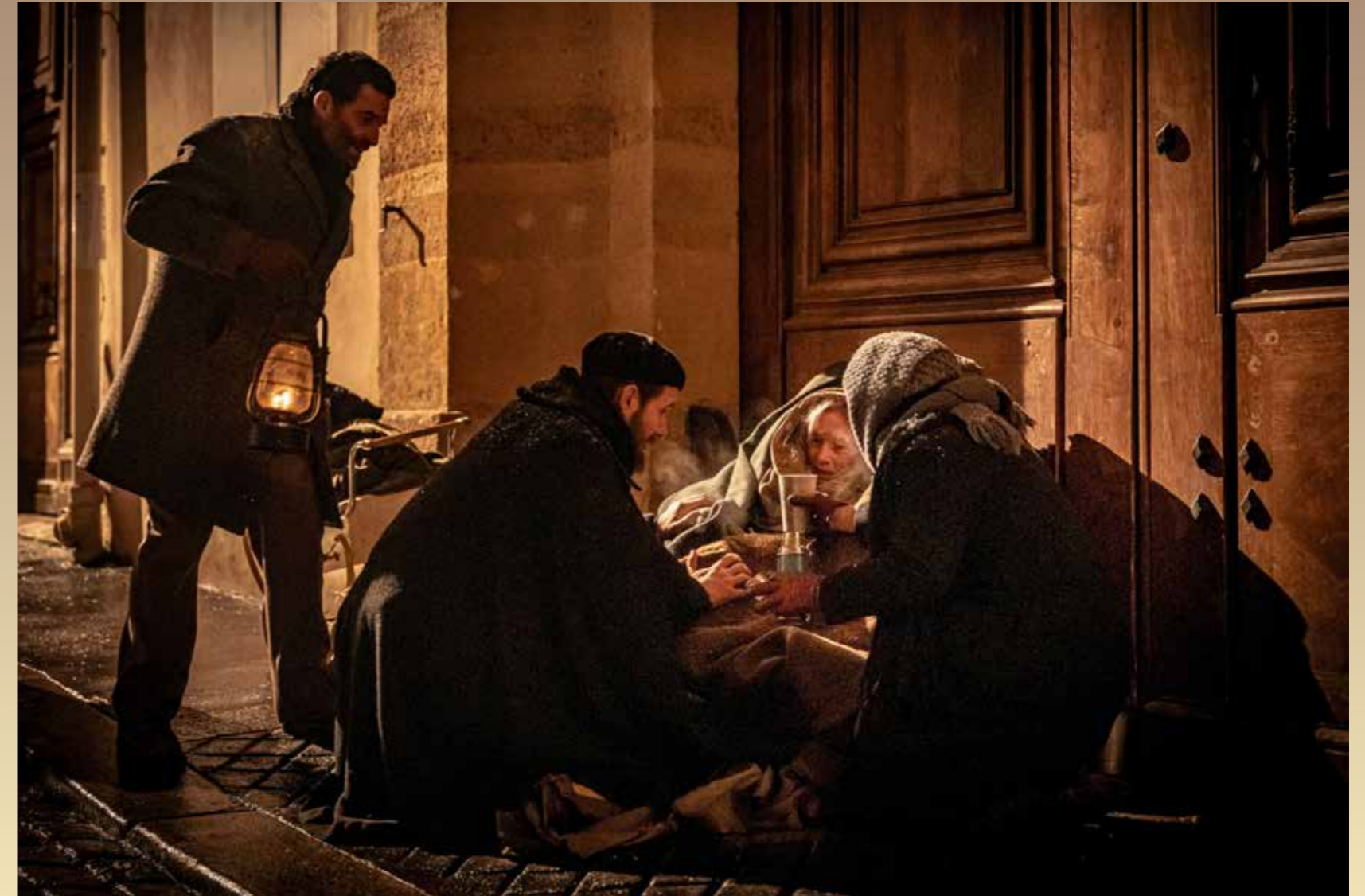
L'abbé Pierre pendant l'hiver 54, dans le film

Je crois qu'il a laissé quelque chose d'essentiel : respecter chacun pour ce qu'il est, laisser à chacune et chacun le droit de faire ses propres choix, d'avancer à son rythme. Il avait une immense foi en l'Homme. Pour lui, l'enjeu n'était pas d'aider en assistant (et en ce sens, il était en avance sur son temps) mais d'aider en permettant aux gens de grandir par eux-mêmes, de se reconstruire et de « se bouger » pour parvenir à le faire. Chacun a sa chance, chacun a sa place, chacun a une valeur.