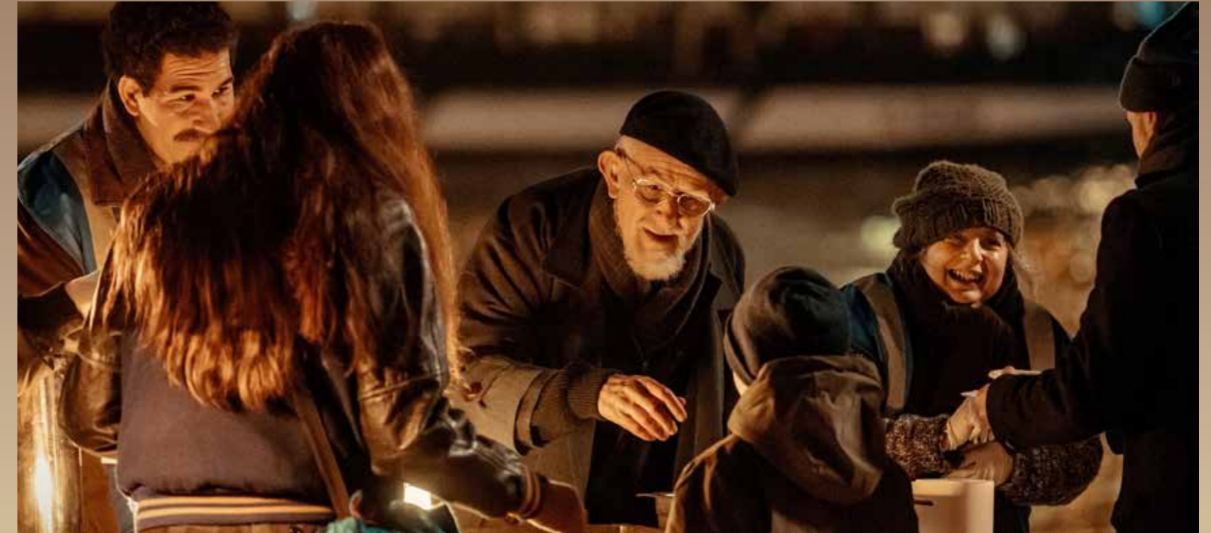
L'abbé Pierre participe à une distribution alimentaire d'Emmaüs, dans le film

Pour aller plus loin, on peut consulter les chiffres de la générosité en France à l'adresse https://www.francegenerosites.org/chiffres-cles/