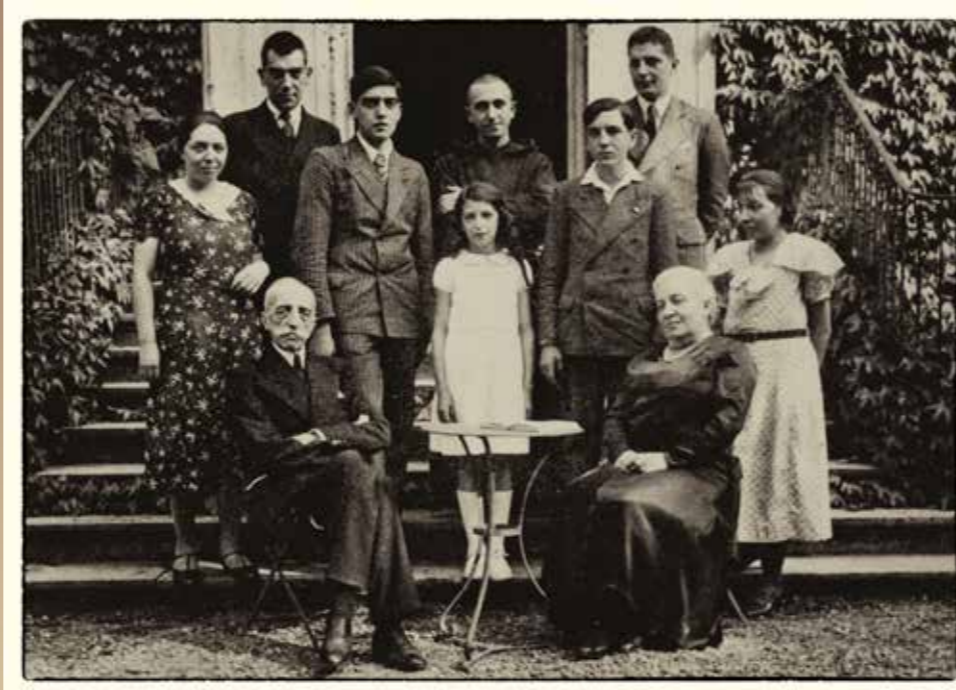
L'abbé Pierre en famille

Grouès entre au couvent des Capucins de Crest (Drôme), ordre des franciscains qui a fait vœu de pauvreté. Après avoir été « Castor méditatif » chez les scouts, Grouès devient « Frère La Joie ». Il est ordonné prêtre en 1938.