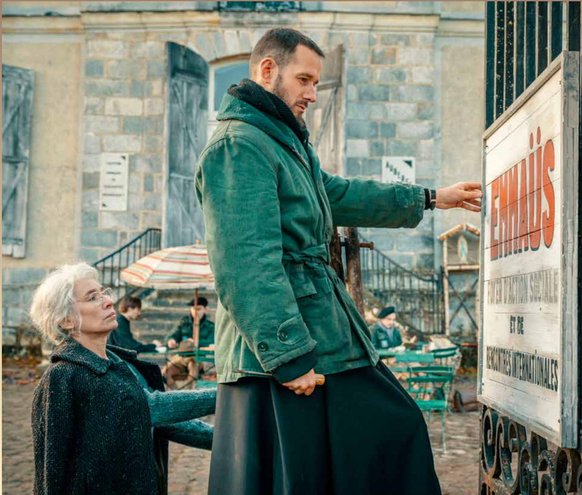
La fondation d'Emmaüs, dans le film