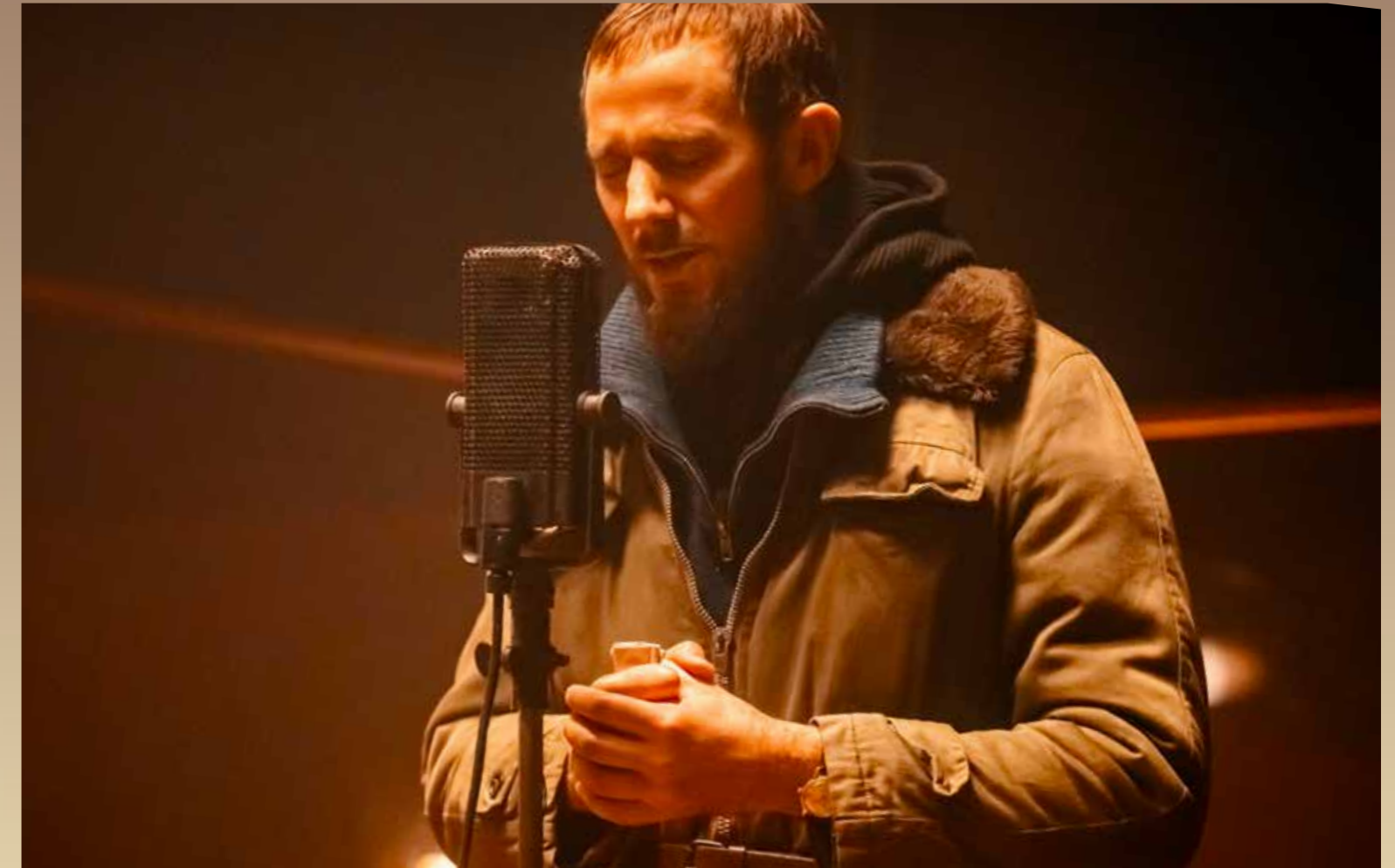
L'abbé Pierre lançant son appel au micro de RTL, dans le film