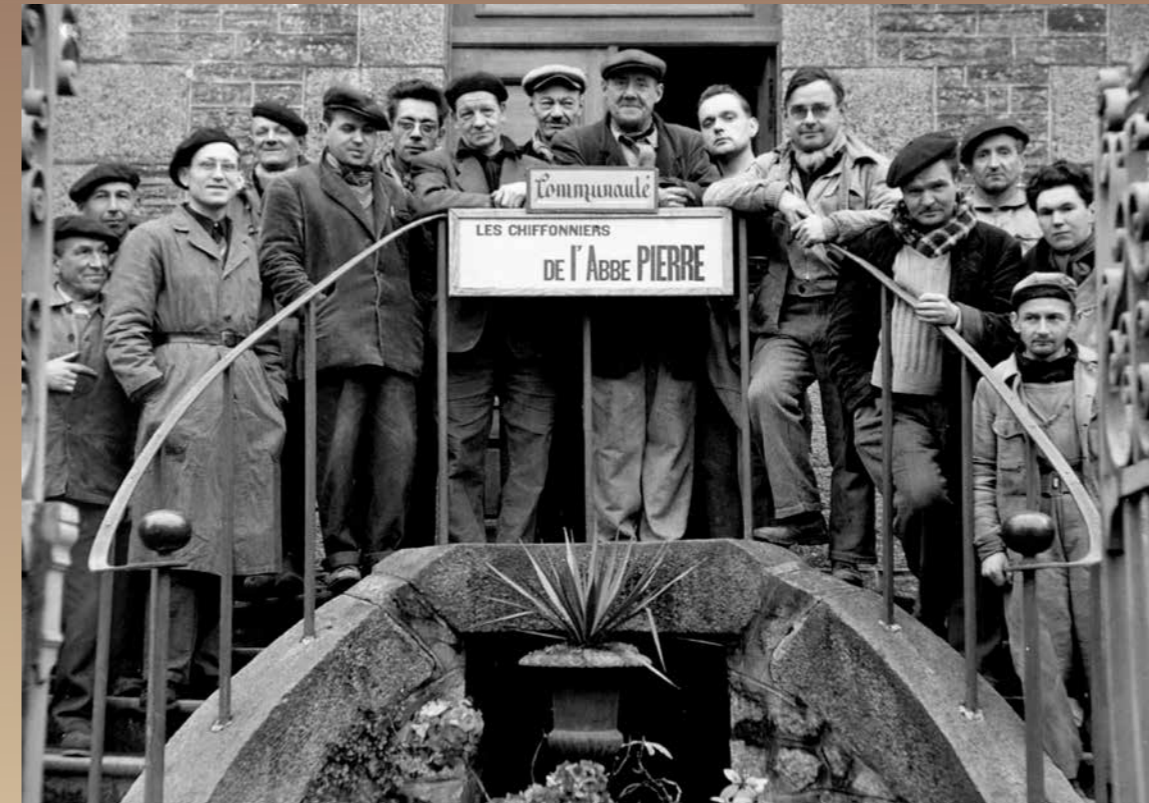
Les compagnons d'Emmaüs à Brest en 1957

Ce modèle solidaire unique est légalement régi par l'article L265-I du Code de l'action sociale et des familles (et non pas par le Code du travail.) Les Compagnons et les Compagnes ne sont pas donc pas employés ou salariés mais bénéficient du statut de travailleurs solidaires. Ils bénéficient d'un accompagnement individualisé qui leur permet de se reconstruire, retrouver une place dans la société, au sein puis éventuellement en dehors de la Communauté.